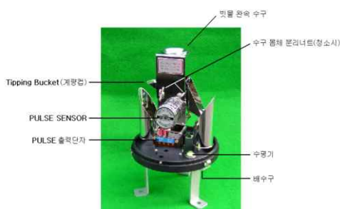
그림 1. 전도형 강수량계

전도형 강수량계는 그림 1과 같으며, 우량 수수구 밑에 한 쌍의 계량컵(Tipping Bucket)을 시소형으로 설치하여 계량컵에 일정량의 빗물이 차면, 중량에 의해 한쪽으로 기울어지고 이때에 발생하는 전기적인 펄스로 강우량을 측정하는 방식으로 연속적인 강우량 측정이 가능하다.