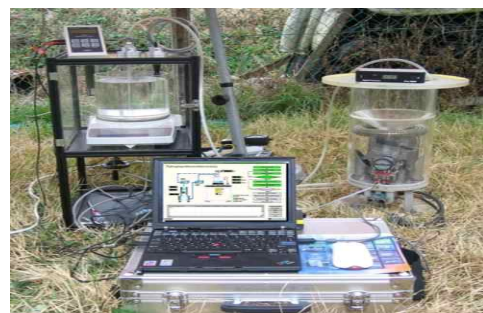
그림 2. 질량측정 방식의 강수량계 교정시스템(현장용)